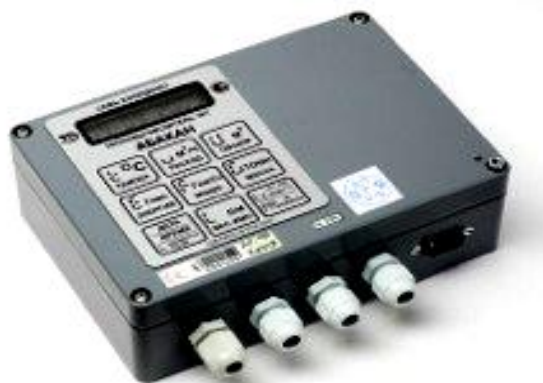
Внешний вид тепловычислителя 7КТ «Абакан» (для всех модификаций теплосчетчика 7КТ)